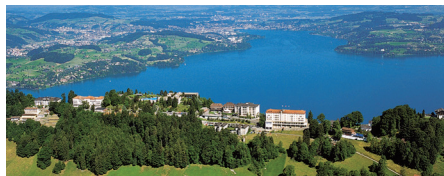
Das Resort Bürgenstock hoch über dem Vierwaldstättersee.

In Zusammenarbeit und Besprechungen mit O + Z konnte die ideale Herstellung gefunden werden, die eine optimale und ästhetisch einwandfreie Verzinkung ermöglicht. Für das